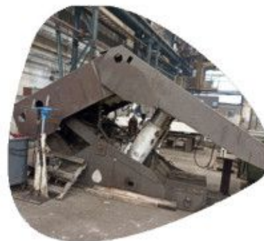
maszyny dla górnictwa